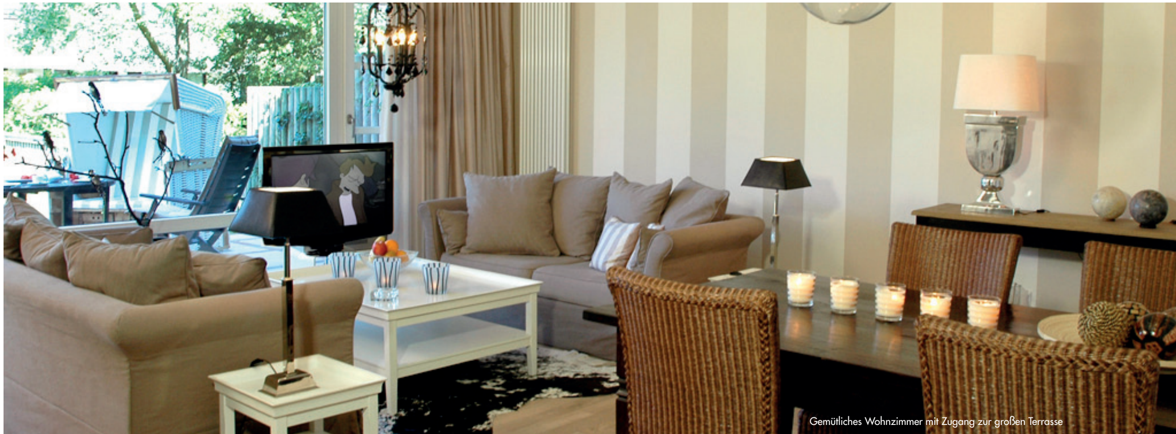
Gemütliches Wohnzimmer mit Zugang zur großen Terrasse